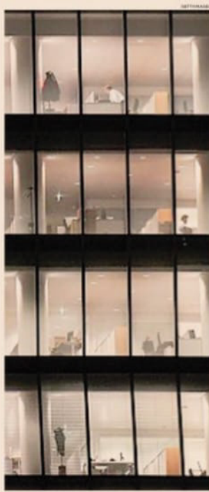
La solitudine del manager. La Torre Allianz di CityLife, Milano

Stesso fenomeno avveniva già pre-pandemia per gli spazi di lavoro. Una scrivania era usata per meno del 16% del tempo giornaliero. Ora con due o tre giorni a settimana di remote working il tempo di uso non supera il 5-6% giornaliero. Eppure si